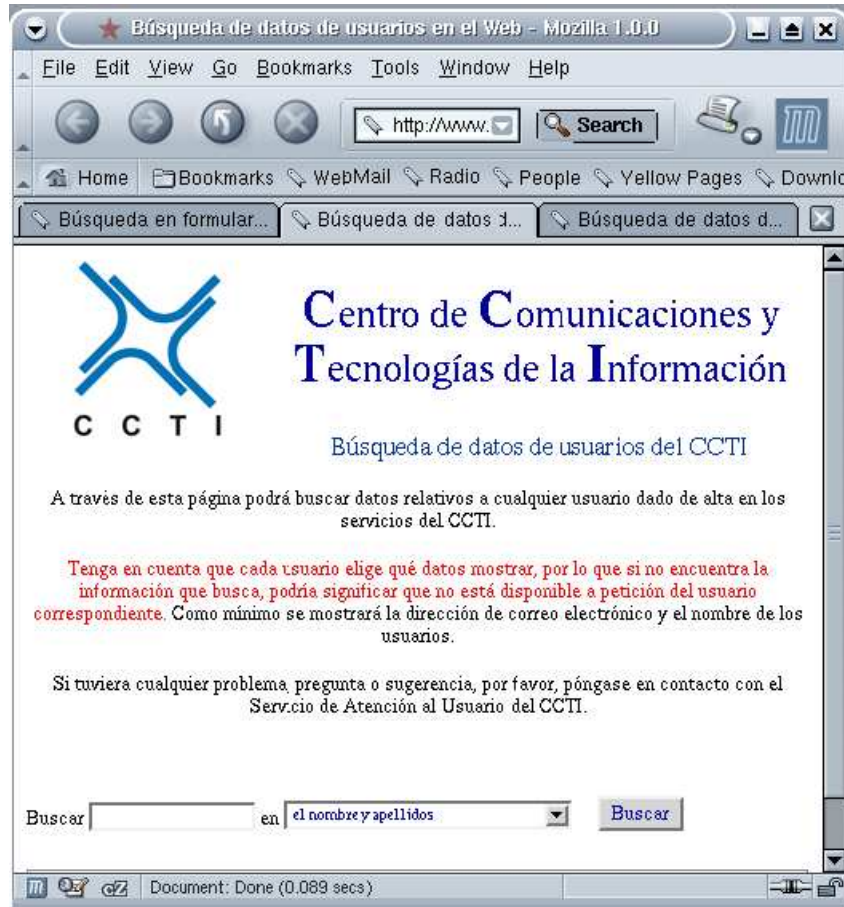
Figura 10.1: El buscador de personas de la ULL

En primer lugar, visite la página en la que esta ubicado: http://www.cti.ull.es/bd/ . La figura 10.1 muestra la interfaz que percibe un usuario humano.